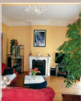
1 SALON : AVANT A HERMALLE