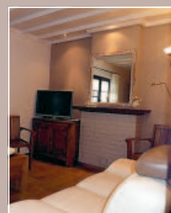
6 PLAFOND : APRÈS A HORION-HOZÉMONT