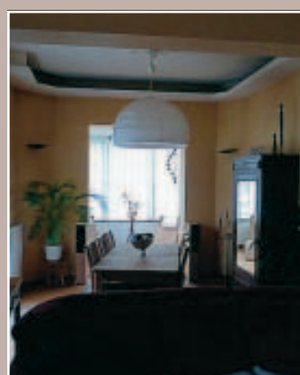
3 LIVING : AVANT A HERMALLE