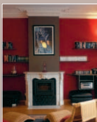
2 SALON : APRÈS A HERMALLE