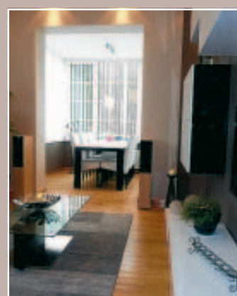
4 LIVING : APRÈS A HERMALLE